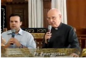
*La Inquisición – Reconciliando a la Iglesia con Israel (Video)

© 1997 Evangelische Marienschwesternschaft e.V. Darmstadt. Alemania